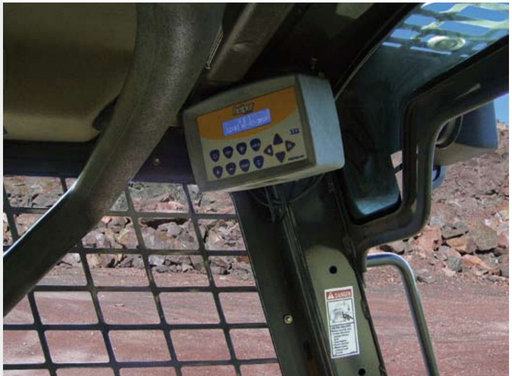
Beispiel für eine Wiegenote