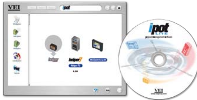
Software zur Nutzlastverwaltung ipot Lite