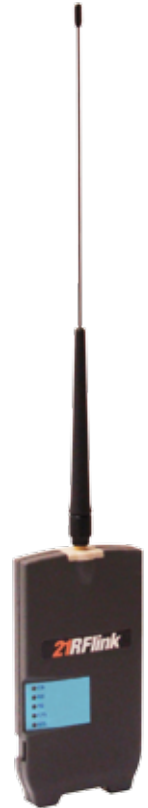
21RFlink radio modem