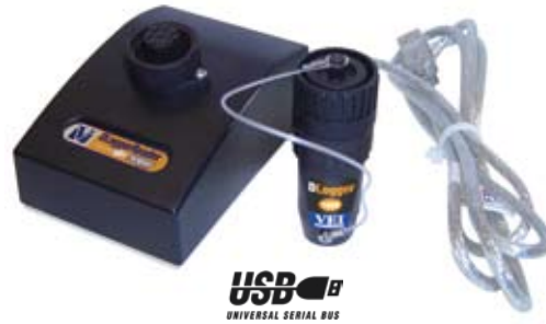
Memorystick für den DLogger DLogger Reader USB

ipot Lite integriert auch Daten von anderen Geräten, wie helper7 und Millennium .